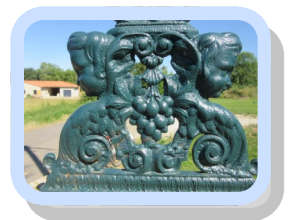
La croix du carrefour du chemin de l'abreuvoir et de la route d'Auzas

Un rapide tour d'horizon nous permettra d'en découvrir quelques unes.